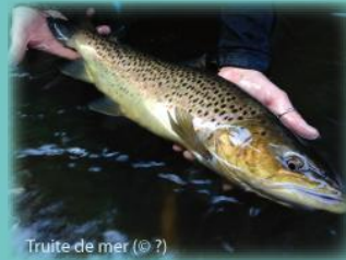
Truite de mer (© ?)