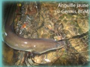
Anguille jaune

SUIVI DE LA REPRODUCTION DE L'ALOSE SUR LE BLAVET ET DE SA CAPTURE PAR PECHE A LA LIGNE (BLAVET, OUST, VILAINE) (2017)