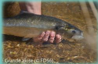
Grande alose