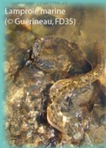
Lamproie marine