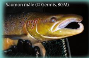
Saumon mâle