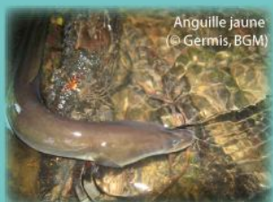
Anguille jaune