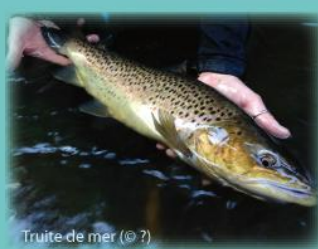
Truite de mer