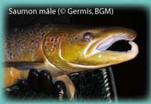
Saumon mâle