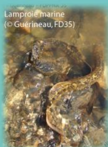
Lamproie marine