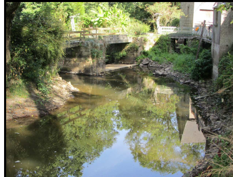
Vue Amont du seuil