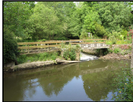
Vue Amont du seuil