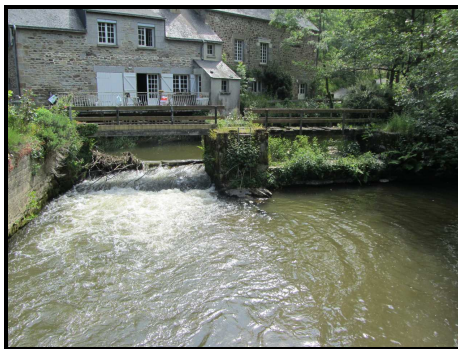
Vue Aval du seuil