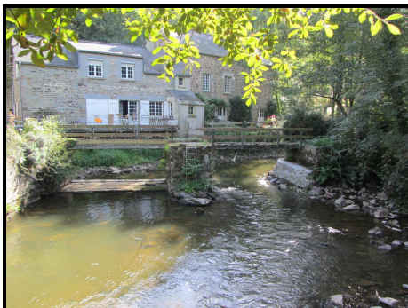
Vue Aval du seuil