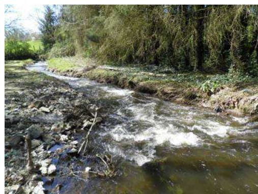
Le Moulin aux Pauvres 1 an après travaux.