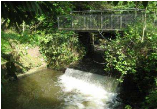
Le Moulin aux Pauvres avant travaux.

1 an après les travaux (décembre 2013), l'ONEMA a réalisé des prospections frayères de saumons sur le Nançon : une quinzaine de frayères ont été observées, dont 3 sur le bras du Nançon restauré en 2012 au Moulin aux pauvres et quelques unes en amont, à un endroit où aucune frayère n'avait été répertoriée jusqu'alors.