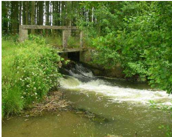
Le Moulin de la Marche avant travaux.

Juste après les travaux, en amont et en aval du seuil, on observait déjà les premiers effets positifs sur le Couesnon : les écoulements sont plus diversifiés et le cours d'eau retrouve des habitats propices aux différentes espèces aquatiques. Ces effets positifs sont encore visibles actuellement.