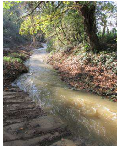
Le Moulin aux Pauvres juste après travaux.