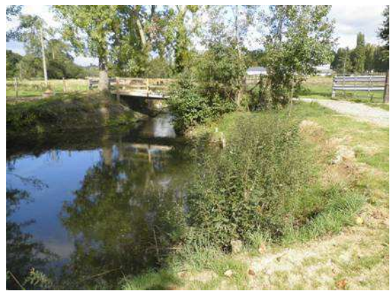
Le Moulin de la Marche 1 an après travaux.

Au Moulin aux Pauvres , situé sur le Nançon à Fougères, l'ancien lit du Nançon a été restauré sur environ 150 ml, afin de supprimer tout obstacle à la remontée des poissons migrateurs. Auparavant, toute l'eau du Nançon transitait par le bief de l'ancien moulin, sur lequel un seuil de 65 cm de haut empêchait la libre circulation des espèces, des sédiments, et des poissons migrateurs (saumons, anguilles, truites,...). Ce seuil n'avait plus aucune utilité, c'est pourquoi il a été décidé, en accord avec le propriétaire du site, de restaurer le Nançon dans son lit d'origine.