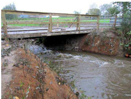
Le Moulin de la Marche juste après travaux.