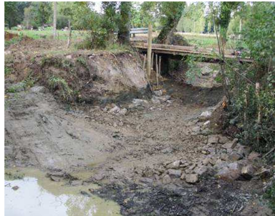
Le Moulin de la Marche pendant les travaux.