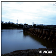
BARRAGE DE VEZIENS