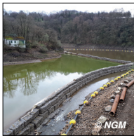
PONT DES BIARDS