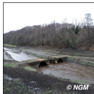
PONT DE LA RÉPUBLIQUE