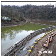
PONT DES BIARDS